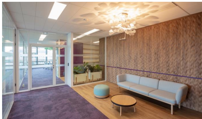
Mission de conception biophilique, Au sein d'une Direction Grand Compte

Notre équipe, composée d'architectes, de designers et de consultants issus du conseil utilisateur, accorde une importance particulière à la co-construction, et l'intégration du collaborateur dans le processus de conception du projet et lui permettre d'adhérer au projet d'entreprise dès sa conception.